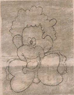
നീതു എലിസബേത്ത് തോമസ്, പടിഞ്ഞാറേത്തരുവ്